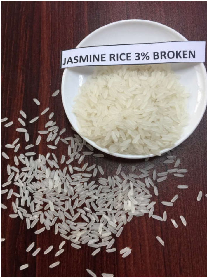
Jasmine rice 5%