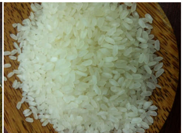
Medium rice 5%