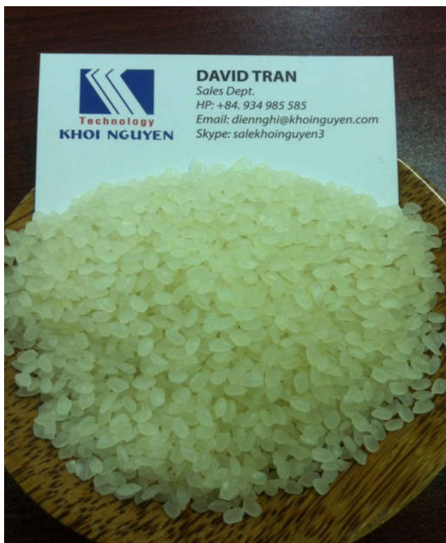
Round rice 5%