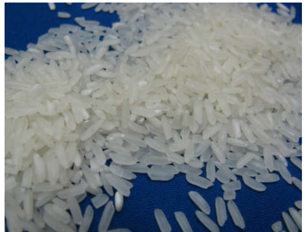
Long rice 5%