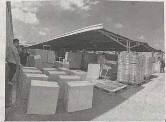
コロナ禍でも輸入量は着実に増えている

情報ポータルサイトを運営するはまぞう(浜松市)は、在日ベトナム人向けの食品輸入業「BETHASU(ベトハス)」をこのほど始めた。ベトナムの拠点を生かして現地食品メーカーと契約する。日本であまり流通していなかった商品を全国の輸入食料品店などに卸す。3年以内に5億円の売り上げを目指す。