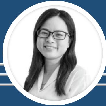
Ms. Tô Thanh Assistant Director